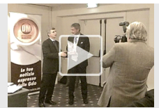
DM Awards 2011: i siti vincenti