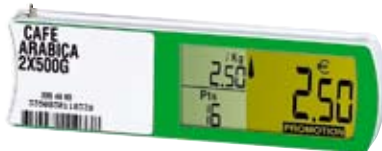
Angebotspreis und Bonuspunkte