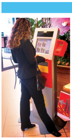
Kiosk CERTO Wincor Nixdorf